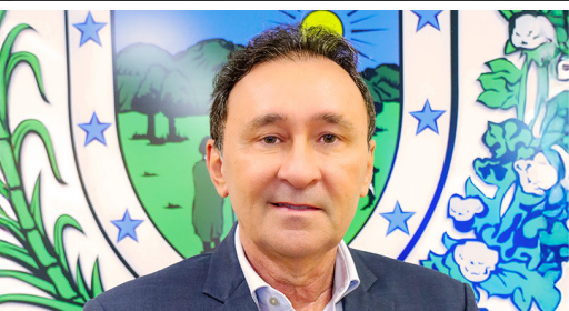
DEUSDETE QUEIROGA FILHO Sec. da Infraestrutura e dos Recursos Hídricos

Com obras estruturantes e visão de futuro, o Estado reafirma seu papel no desenvolvimento regional sob a liderança do governador João Azevêdo , que tem transformado planejamento em resultados concretos.